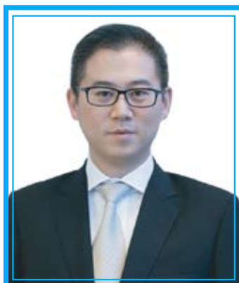
นายกุลสิทธิ์ วงษ์เจริญ ประธานเจ้าหน้าที่บริหาร