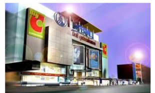
Imperial World Samrong