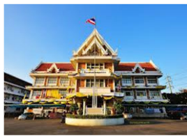
ศาลากลางจังหวัดสมุทรปราการ